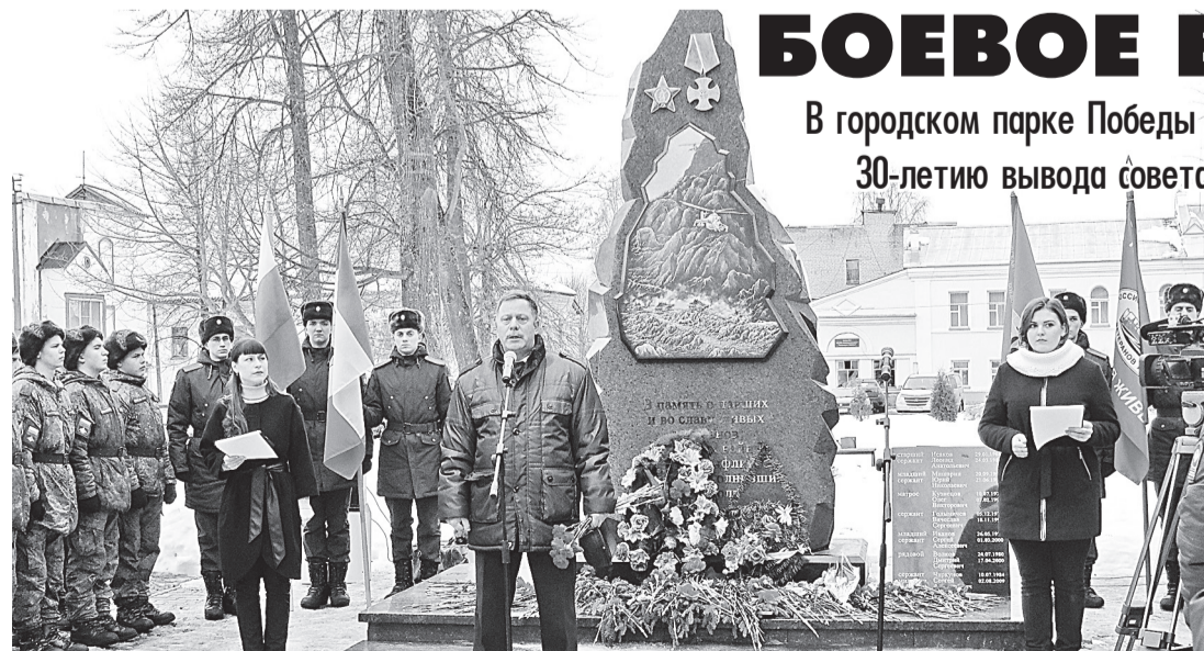
Мы помним тех, кто отдал жизни за Отчизну