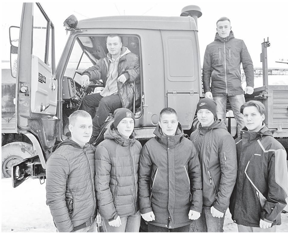
Идут занятия во взводе большегрузных машин

Уважаемые боровичане! Поздравляем вас с Днём защитника Отечества!